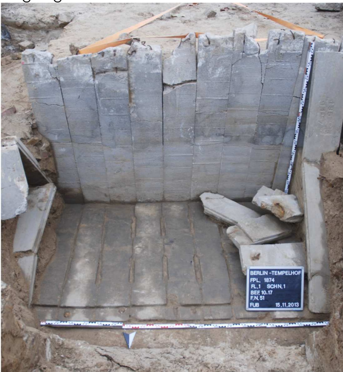
Ein Sichtfenster könnte den Grabefund zeigen.

Hier ist ein ca. zwei mal zwei Meter Stück eines gut erhaltenes Splitterschutzgrabens freigelegt worden.