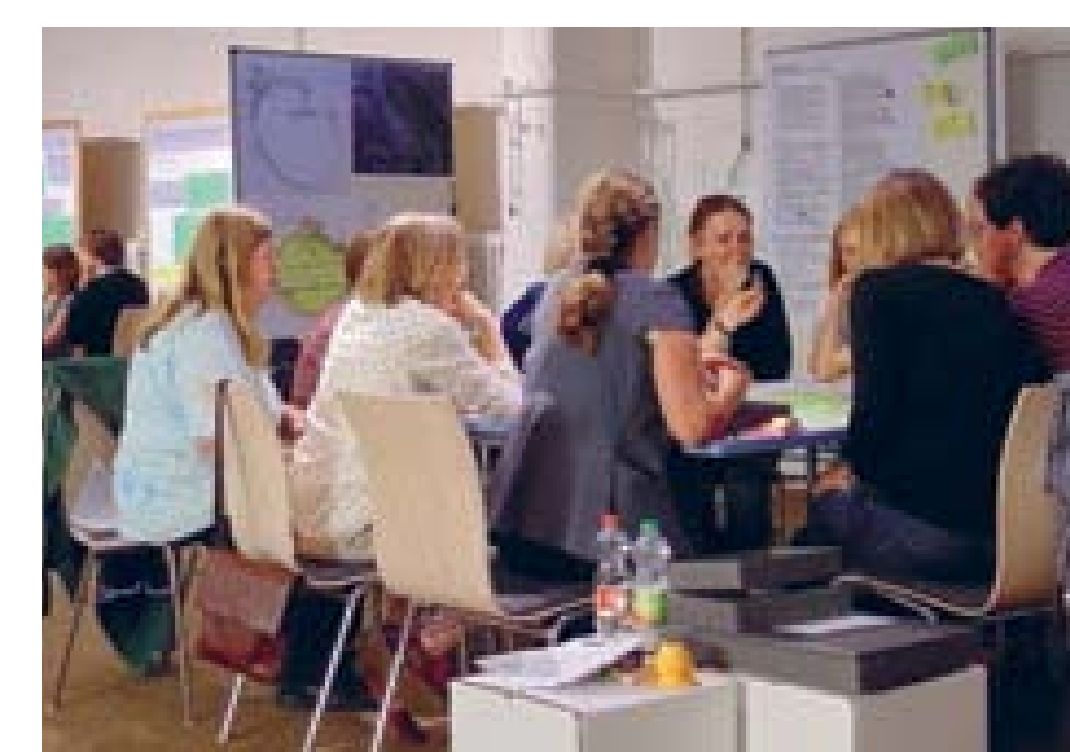
Vorortung der Nutzungsideen, 1. Raumnutzungswerkstatt, 29.06.2015

Die vertiefte Diskussion einzelner Themen erfolgt in Informations- und Arbeitstreffen. Diese für alle Interessierten offenen Werkstätten finden auf Einladung der Feldkoordination zu den Themen Naturschutz, Geschichte/Erinnerung und Projekte/Bürgerschaftliches Engagement mindestens einmal pro Jahr statt, zu weiteren Themen nach Bedarf. Zur inhaltlichen Umsetzung des Entwicklungs- und Pflegeplans werden unter Anwendung der „Charta der Beteiligung“ (→ Anlage 2) partizipative Planungsprozesse aufgesetzt, insbesondere für die Konkretisierung der Nutzungskonzepte und Planungen für die Bereiche Oderstraße, Columbiadam, Tempelhofer Damm, Südflanke und Alte Gärtnerei (→ VI.3).