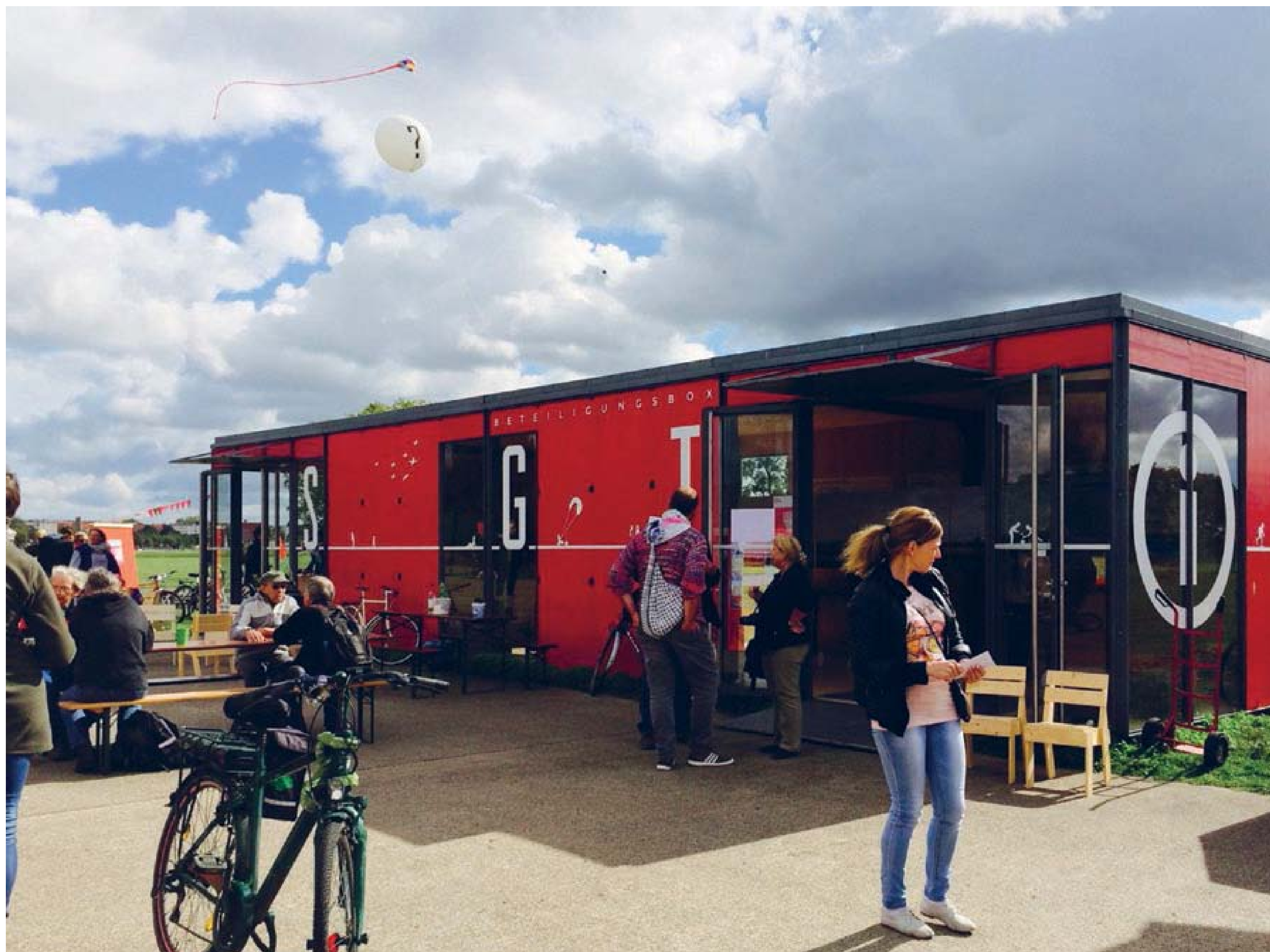
Infopavillon am Columbiadamm als Beteiligungsbox am Tag der Feld- dialoge, 20.09.2015

Das Modell der Zusammenarbeit wird mindestens alle 3 Jahre ausgewertet und bei Bedarf angepasst und fortgeschrieben.